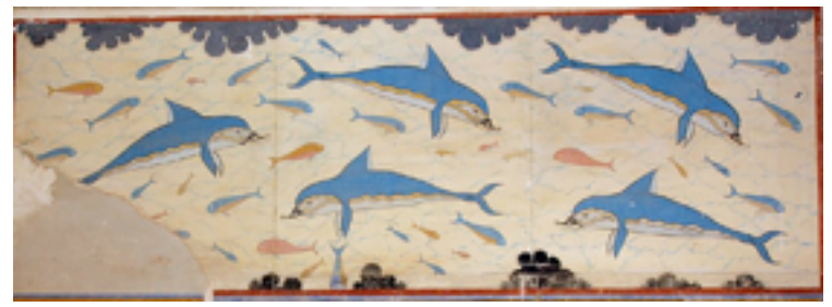
クノッソス宮殿壁画