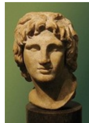
アレクサンドロス