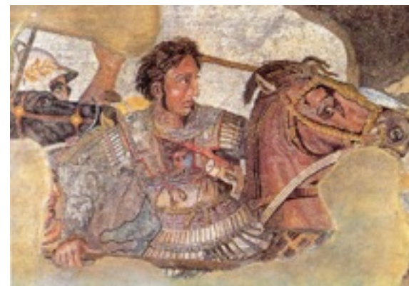
アレクサンドロス (ポンペイ出土モザイク壁画)