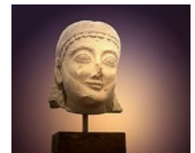
アルカイックスマイル