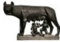
ロムルスとレムス