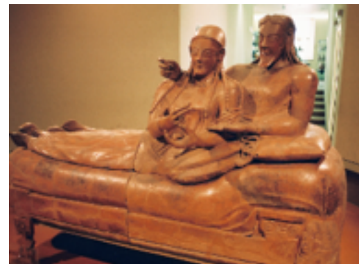
エトルリア人の夫婦の棺

⇒ ( )31派=オプティマテス と 平民派=ポプラレス の 抗争 貴族・富裕層(新貴族ノビレス) 下級貴族・平民