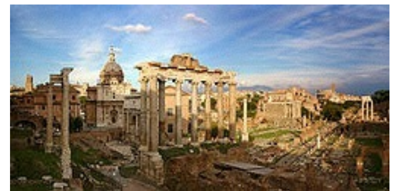
フォロロマーノ(ローマ)