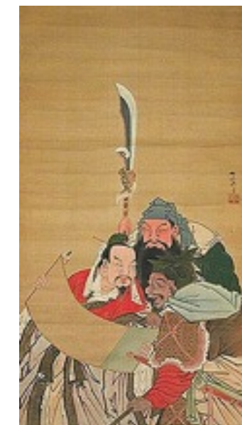
劉備・関羽・張飛