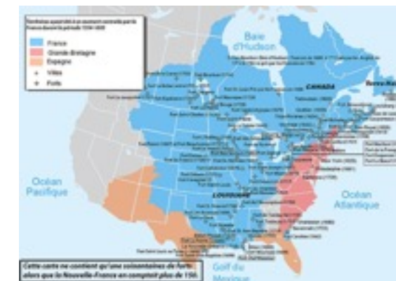
18世紀の北米植民地