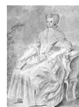
オランプ=ド=グージュ

・革命 ・公安 ・総裁 ・女性 ・普通 ・制限 ・対仏 ・戦争 ・義勇 ・徴兵 ・年貢 ・奴隷 ・1793年 ・共和政 ・ゲーテ ・革命戦争 ・国民公会 ・ジロンド(2) ・イタリア ・コルシカ ・ファイヤン ・メートル ・ヴァンデ ・グージュ ・ヴァルミー ・コンドルセ ・トゥーロン(2) ・マルセイユ ・コミューン ・ジャコバン(2) ・テルミドール